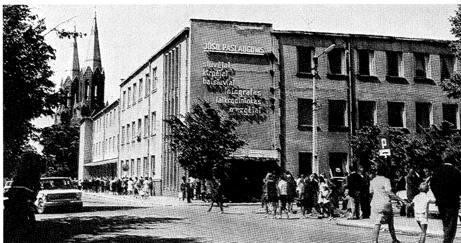
Anykščių miesto centras.